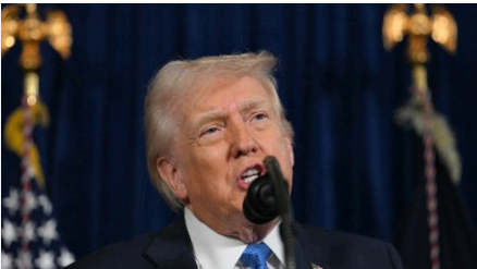
特朗普威脅代理總統 還稱 “絕對需要格陵蘭島”

澳門要以教育改革為抓手，強化本土人才供給與產業需求的精準對接。在基礎教育階段，要深化科普科創教育與人工智能教育融合；要在職業教育領域，新增更多「1+4」產業發展的職技課程，推動學校與企業簽訂合作意向書，培養複合型技術人才；推動職