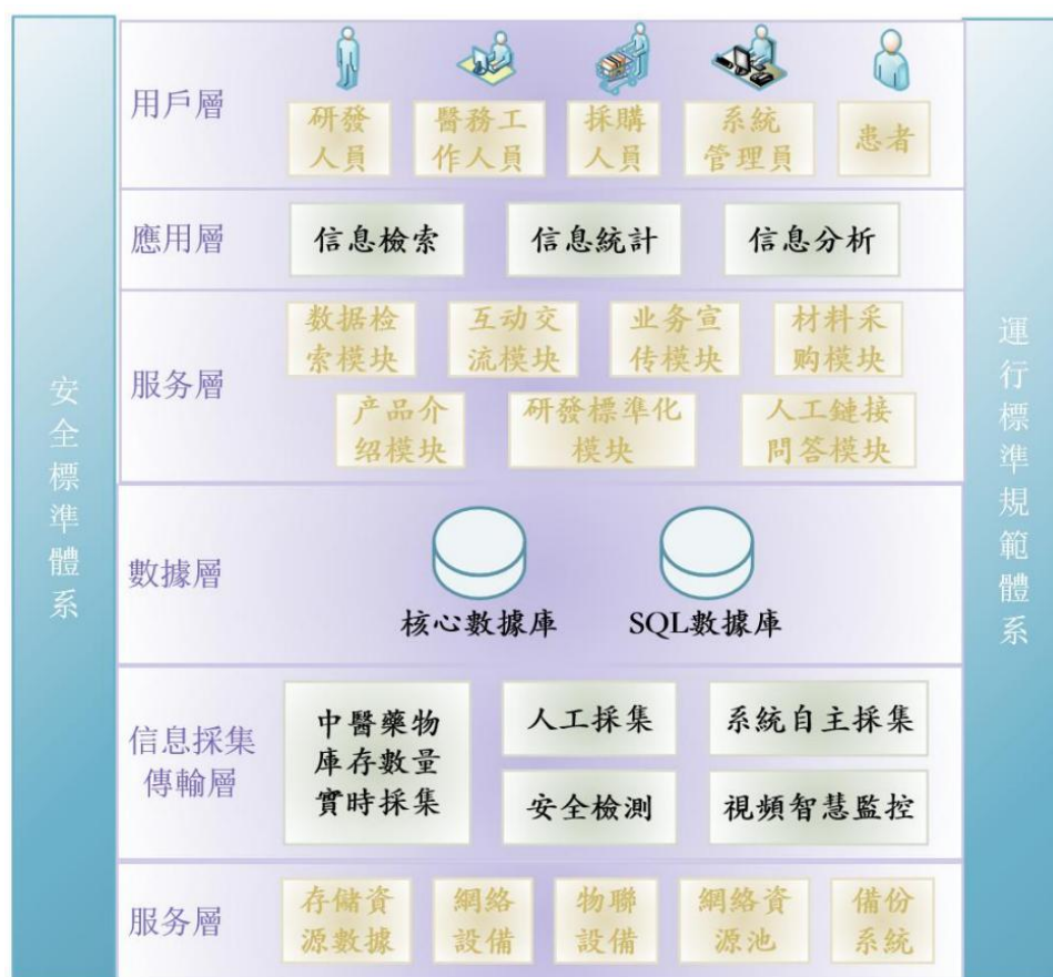
圖 2 橫琴粵澳人工智能中醫藥大模型軟架構體系圖

綜合而論，SWOT-AI 融合策略不僅能精準補足現階段深合區中醫藥大健康產業的發展短板，更可助力“深合區”打造引領粵港澳大灣區乃至“一帶一路”沿線地區的中醫藥高質量發展核心樞紐。未來，隨着人工智能技術全面滲透至中醫藥標準制定、智慧診療服務、產業全鏈治理等關鍵環節，深合區中醫藥大健康產業將逐步形成“國際化、智慧化、集羣化”的發展新格局，既為澳門經濟多元化轉型提供長效發展動能，也為區域協同發展及中醫藥全球化傳播開闢了全新路徑。