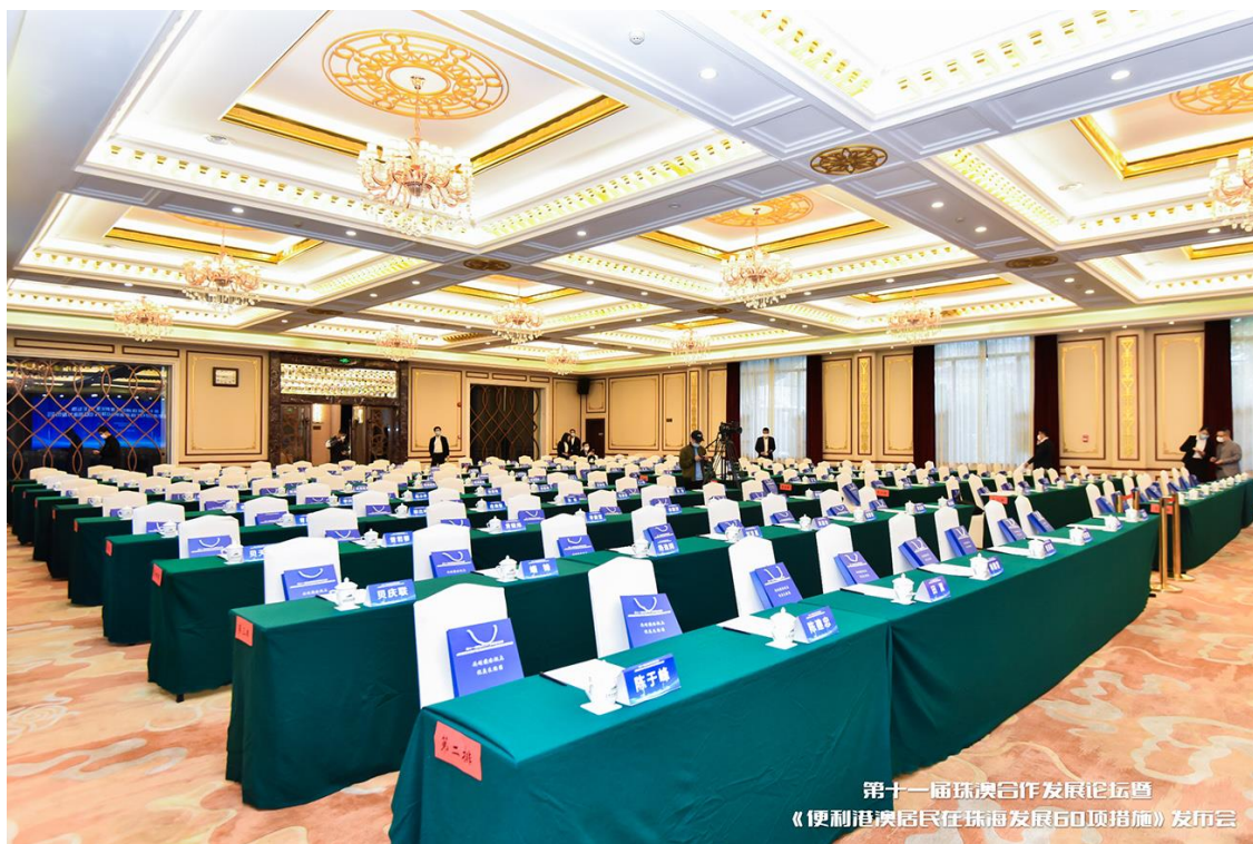
第十一屆珠澳合作發展論壇 《便利港澳居民在珠海發展60項措施》發布會