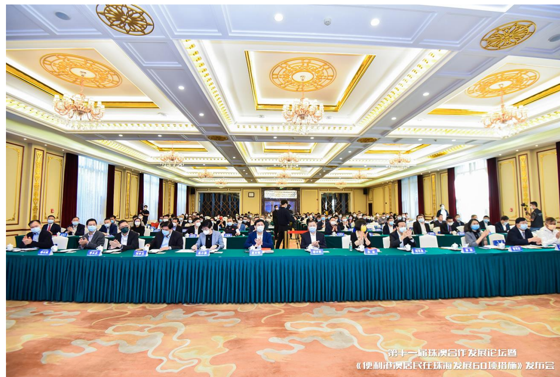
第十一屆珠澳合作發展論壇 《便利港澳居民在珠海發展60項措施》發布會